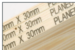
Marquage sur bois