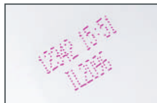
Marquage sur plastique