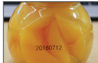
Marquage sur verre